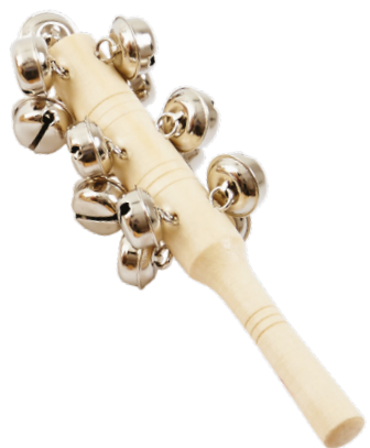
BÂTON À GRELOTS