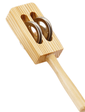
BÂTON À CYMBALES