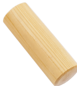
ARBRE À PLUIE